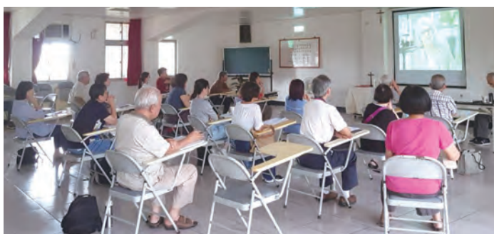
▲講師講解，團體觀看美國小磐石讀經小組的實況。