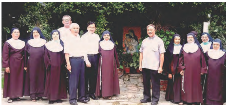
▲聖佳蘭隱修院院長修女特別破例，讓神長入院參觀。