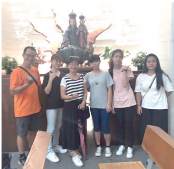
▲大溪聖方濟生活園區，體驗綠化建築之美！

我也給小隊裡的每個人寫了一張卡片，後面合起來是一張圖，這也代表了我們一起在這個活動中相聚過，缺一不可，很期待下次再和大家再聚，這次的活動讓我感覺很美好，認識了很多新朋友，每個人都很好、很活潑且樂意分享，我也很佩服教友們的精神，真是讓我感嘆！