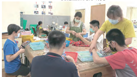
▼聯華電子節能服務隊協助仁愛基金會安裝LED節能燈具，使縫紉區光源明亮。

蛋捲桌安置新插座等服務。尤其近年籌募資源不易，特別感謝聯華電子節能服務隊在此時提供節能、節水、環保、消防等多面向專業的輔導與安全改善服務，以實際行動讓愛發光，幫助節省50%以上照明用電費用，並提供身心障礙朋友明亮、舒適又安全的學習環境。