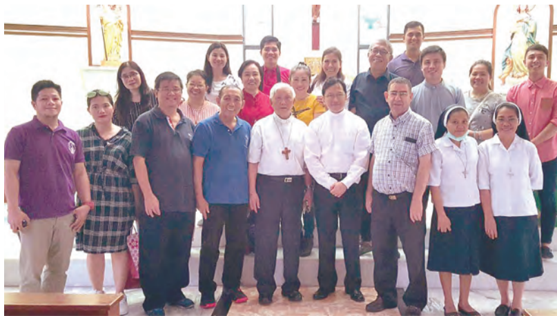
▲中山路聖母無玷原罪始胎天主堂與外籍教友們歡欣合影