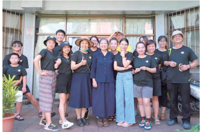
▲在台灣的越南同學會SHIP團體，出航傳愛，以愛還愛。