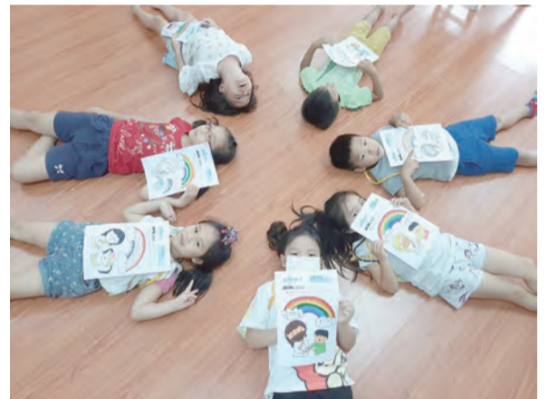
▲信班的小朋友頗有創意地展現教學成果

孩子們從早到晚都精力旺盛，陪伴的大哥哥、大姊姊都疲於奔忙，檢討後才發現，原來是伙食和點心太豐富的關係啊！每節下課，愛心媽媽們都會擺上精緻的點心、綠豆湯、檸檬愛玉、仙草、波霸奶茶等飲品無限量供應，神