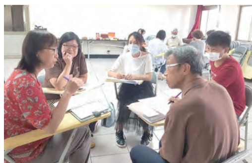
▲學員分組討論，信仰交流，收穫滿滿。