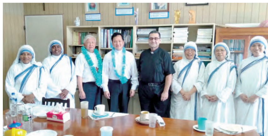
▲會晤仁愛傳教修女會