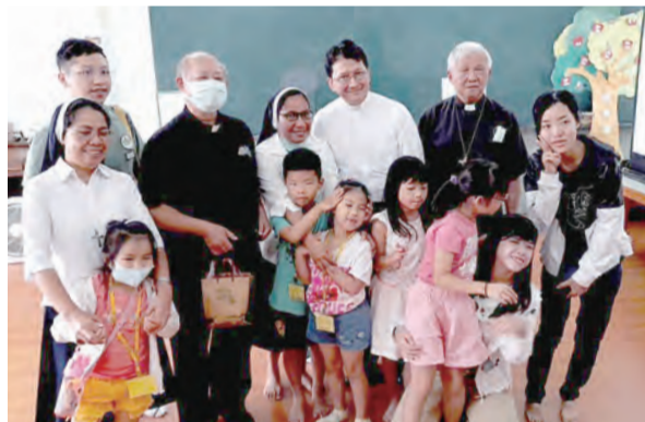
▲在暑期聯合要理班的孩童身上，看見教會的希望！

他也謝謝大家在不同的崗位上，在社福工作、監獄工作、為弱勢與貧窮者的服務中，活出天主的恩寵。座談會會後，教區傳協會理事們另設宴款待，邀請林主教、佳代辦及神長們共進晚餐，佳代辦訪視教區的第一天行程，就在喜樂的共融餐會後畫下句點。