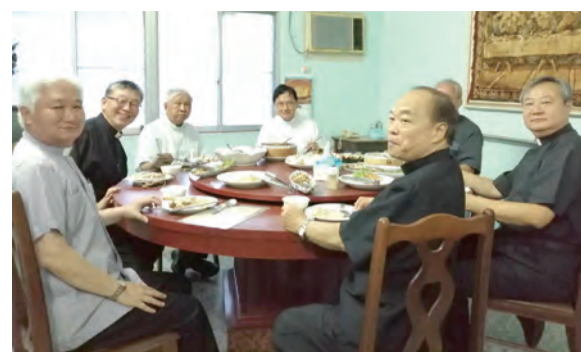
▲與台南教區神父們共融餐敘，神職弟兄間的情誼溢於言表！