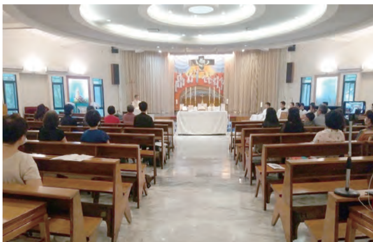
▲拉丁文禮儀團體以特殊形式羅馬禮慶祝聖母升天節，並竭誠歡迎更多人的參與。

台 灣拉丁文禮儀團體於8月15日下午，在輔仁大學淨心堂慶祝聖母升天節的彌撒。特別的是，這台彌撒是以「特殊形式羅馬禮」來進行的。對比於我們今日所使用的「一般形式羅馬禮」，「特殊形式羅馬禮」指的是天主教會1970年以前所使用的彌撒形式。也因為有了舊與新的分別，前者又稱為傳統彌撒，後者則稱作新禮彌撒。