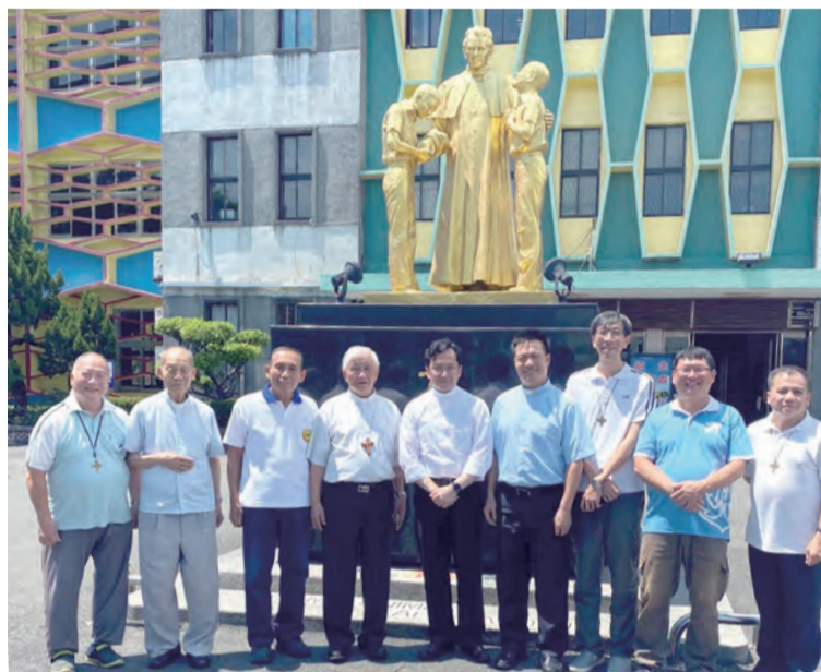
▲慈幼工商職業學校孕育眾多神職校友。

下午3時30分，佳代辦與教區神父們進行座談，教區神父們竭誠歡迎佳代辦的蒞臨；在隨後的致詞時，他首先感謝林主教的邀請，並精心安排了這三天的訪視行程，佳代辦再一次地重申：「教宗一直非常關心與注目台灣教會，聖座派遣外交使節到台灣，就是很重要的證明。至於中國大陸方面的問題，在那裡有非常多的天主教徒，是需要被關懷並為他們祈禱的；但現在特殊的政治因素，仍有非常多的困難待解決。教宗知道台灣人民希望他能來台灣訪問，但不能不顧慮到中國大陸教會的困境，請大家體諒。」對於連日來在台南教區的參訪，佳代辦也勉勵大家：「台南教區秉持著福音的精神從事教會的事業，例如：學校、社福機構、醫院及監獄等，要為窮人、受苦的人及弱勢者服務。然而，教會事業並不是為了成就個人，而是為光榮天主，更以聖鮑思高青年牧