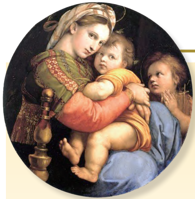
▲仁慈聖母，請為我們祈禱！（文藝復興三傑 拉斐爾名作）