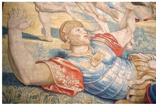
▲以線作色，深淺層次，呈現瞻眺生動的人物 ▲拉斐爾的壁毯刺繡與米開朗基羅的壁畫相輝映 ▶一窺壁毯世界的奧秘

此10幅壁毯分別是：1.聖德範的亂石；2.捕魚的奇蹟；3.癩子的治癒；4.掃祿歸化；5.交付鑰匙予