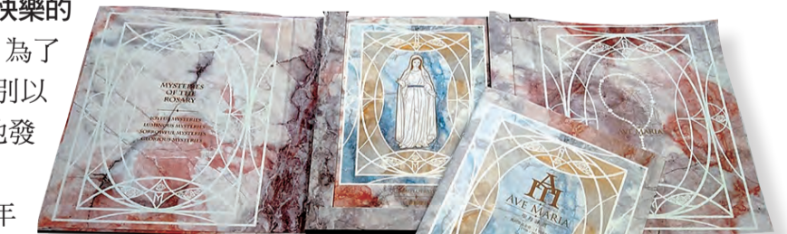
▲打開可以作祈禱門的雙CD外盒 ▲樂譜集內有齊全的五線譜版本