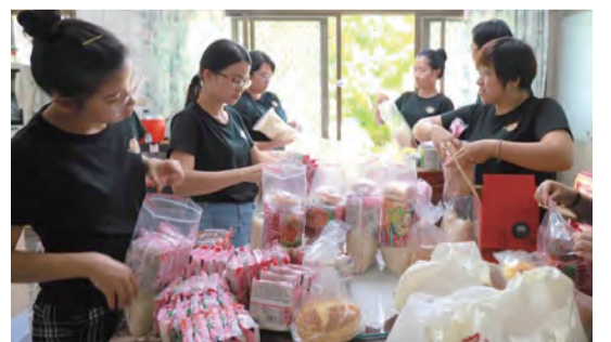
▲越南同學會SHIP成立食物銀行，每周一次給越南、印尼、菲律賓、馬來西亞的學生們享用！