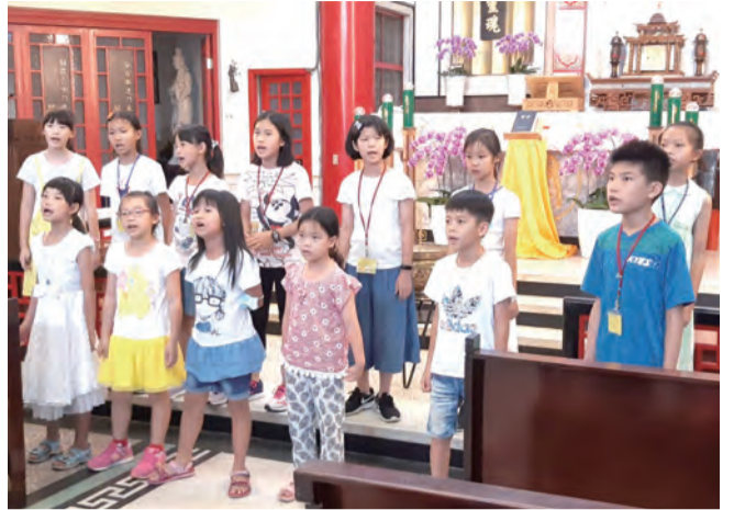
▲要理班結業彌撒中孩子們天真純潔的聖歌表演