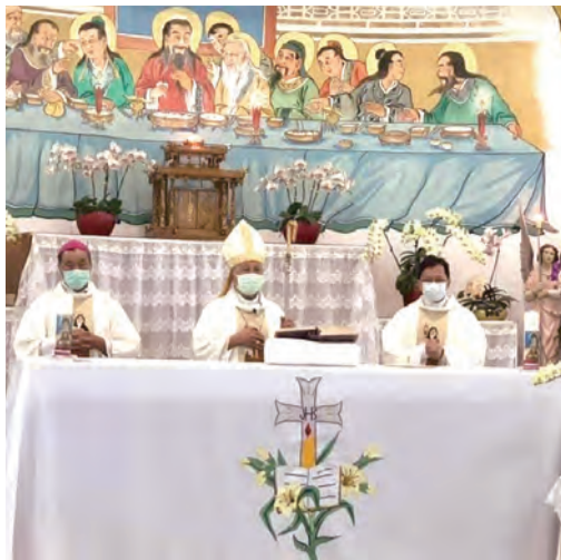
▲在鹽水天主聖神堂彌撒，全程遵守防疫規定。