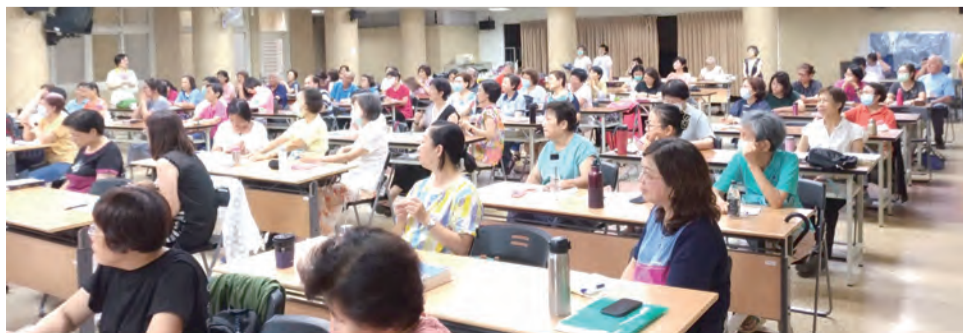
▲台北聖經協會非常有創意的講座，參與學員認真學習，收穫滿滿。

我們在手抄《聖經》時，一方面以「心」讀經修行，另一方面又以「手」書寫修練，這就是內外兼修、心手雙暢。既要手抄《聖經》，就不要心存敷衍，以求速心態草率為之，那就就喪失了抄寫《聖經》的意義了。林神父在這半日講座介紹了習字的方向，最後期許大家，如果能不斷地琢磨改變，那麼，抄寫《聖經》實在是一舉數得的靈修美事啊！